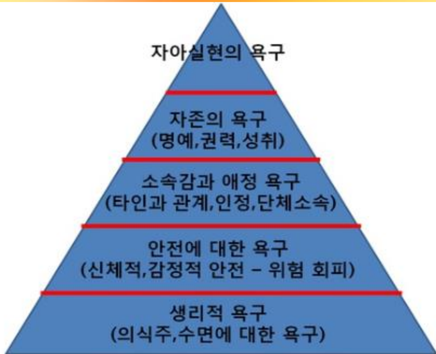
매슬로우의 욕구 5단계 이론